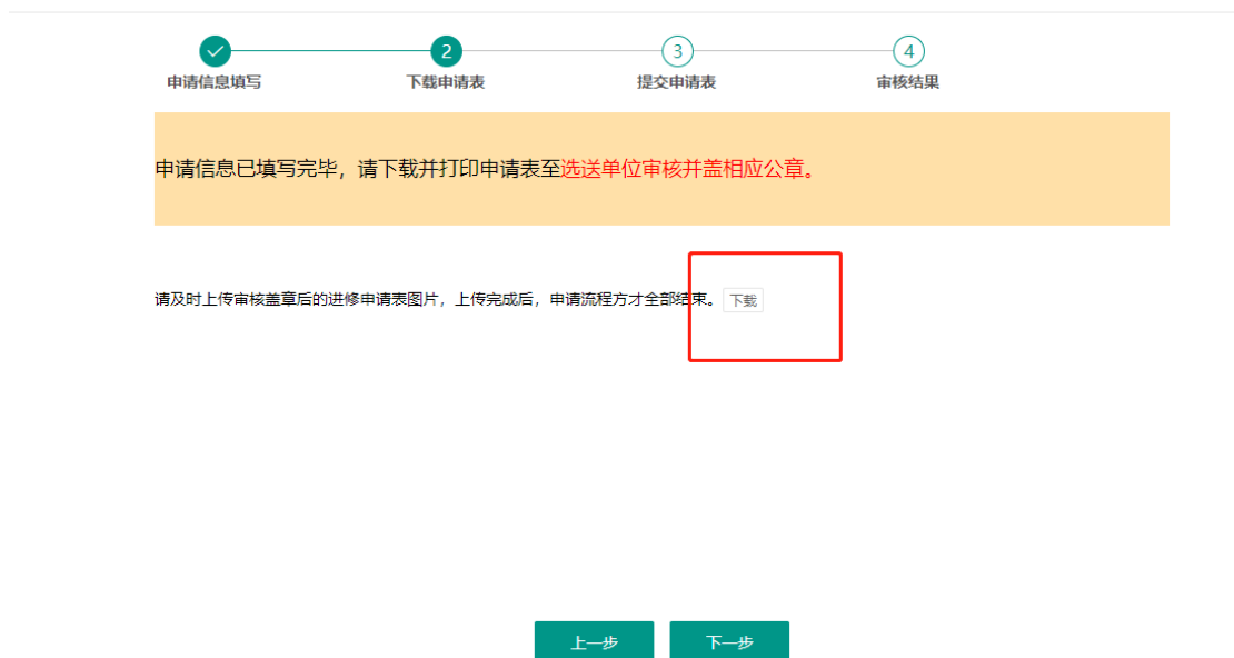
图 2：进修申请书下载