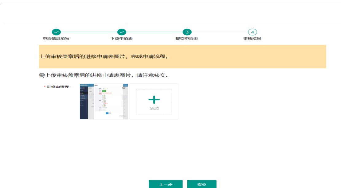
图 3：进修申请书上传及提交