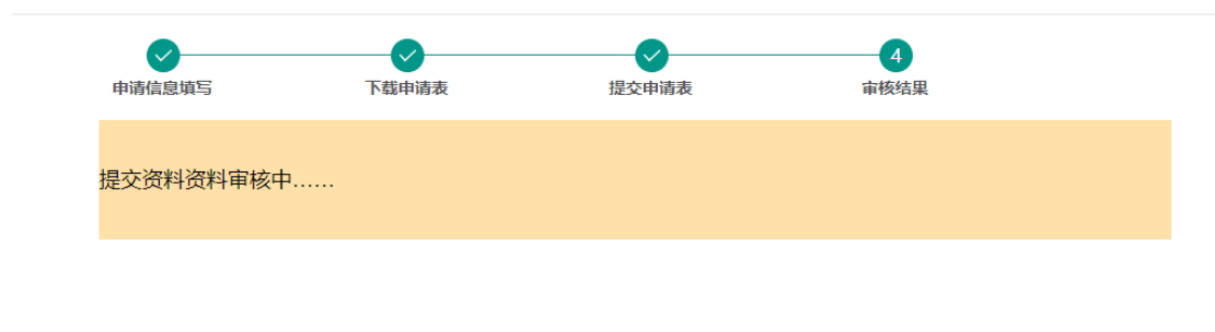
图 4：审核结果查询页面