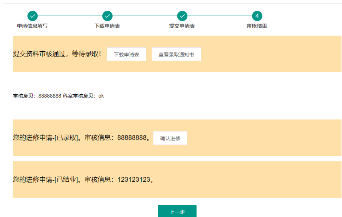
图 5：录取通知书查询及进修确认